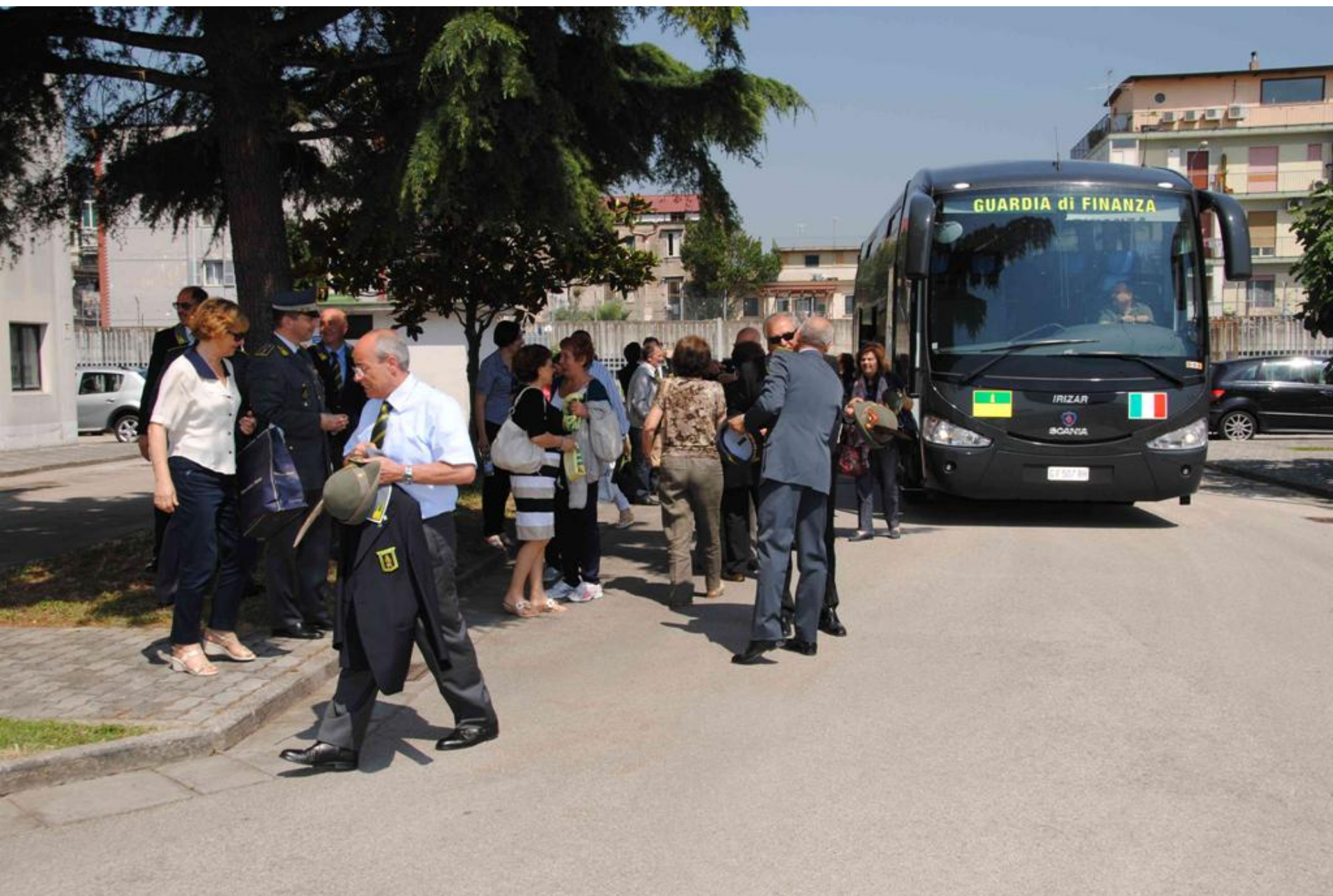
Arrivo dei Soci della Sezione A.N.F.I. di Pratica di Mare con i loro familiari.