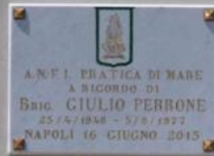
La Targa ricordo.