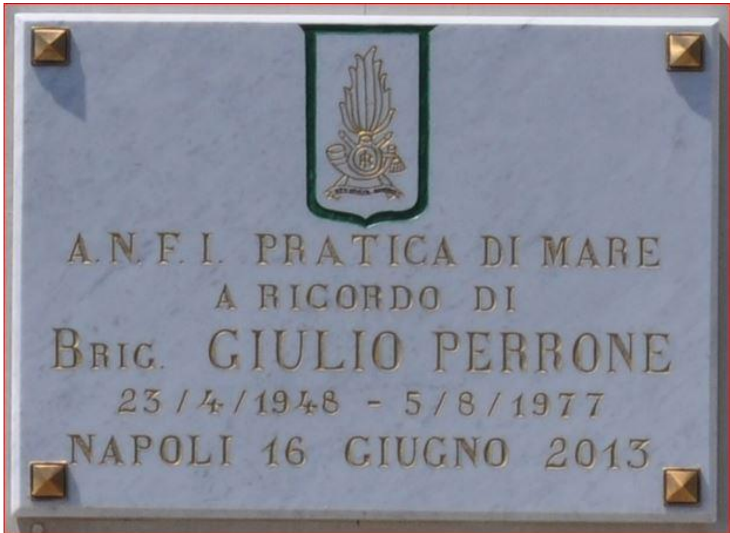
La Targa ricordo.