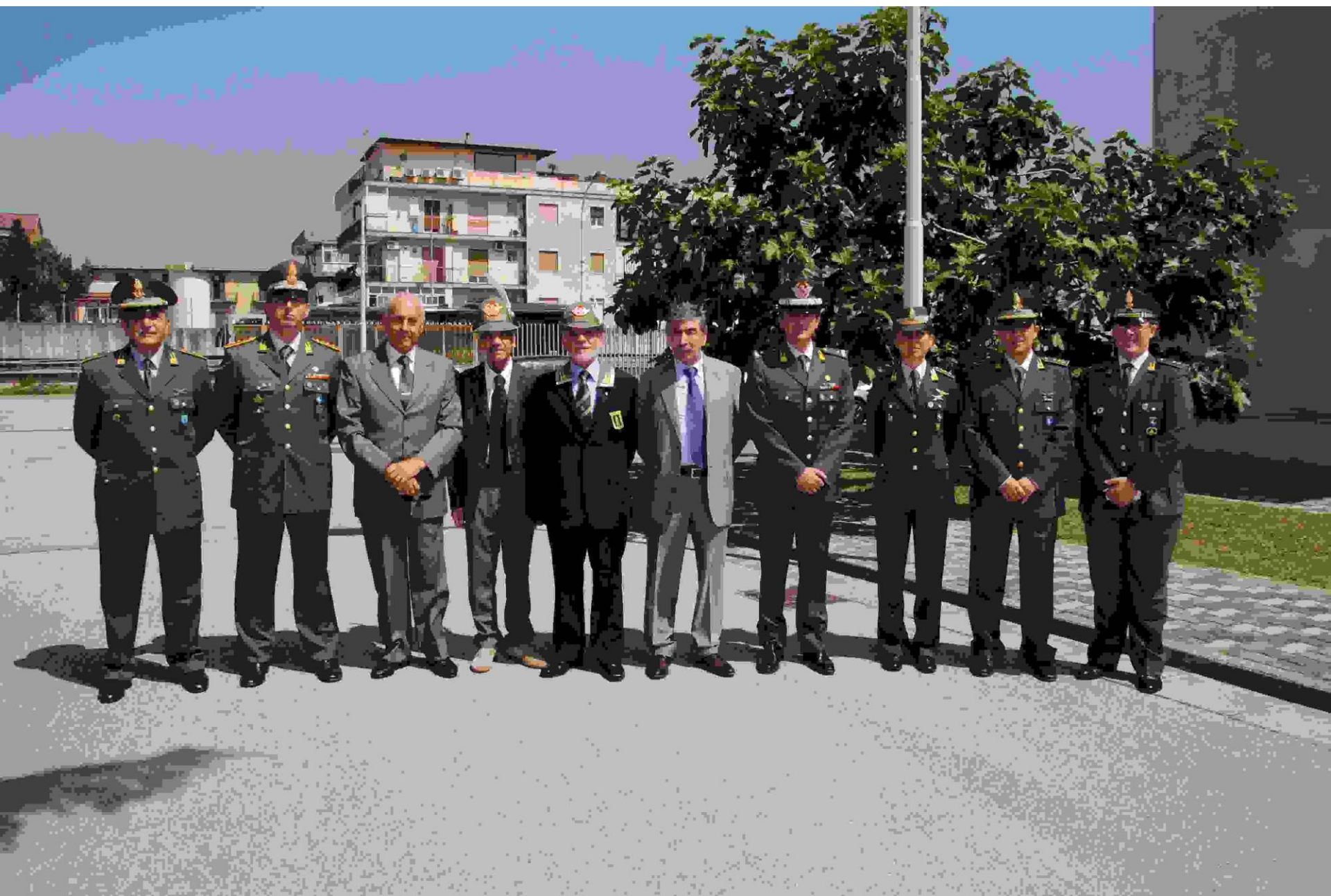
Autorità, Soci e Ufficiali del Reparto.