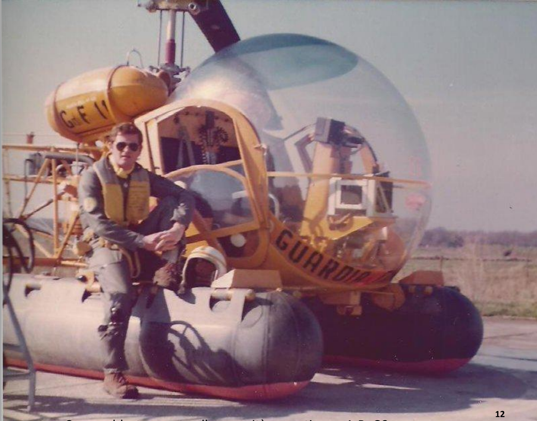
Corso addestramento alla capacità operativa su A.B. G2