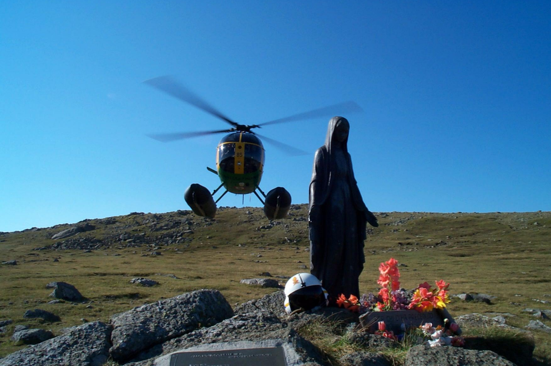
Monte Penna (Appennino Ligure)