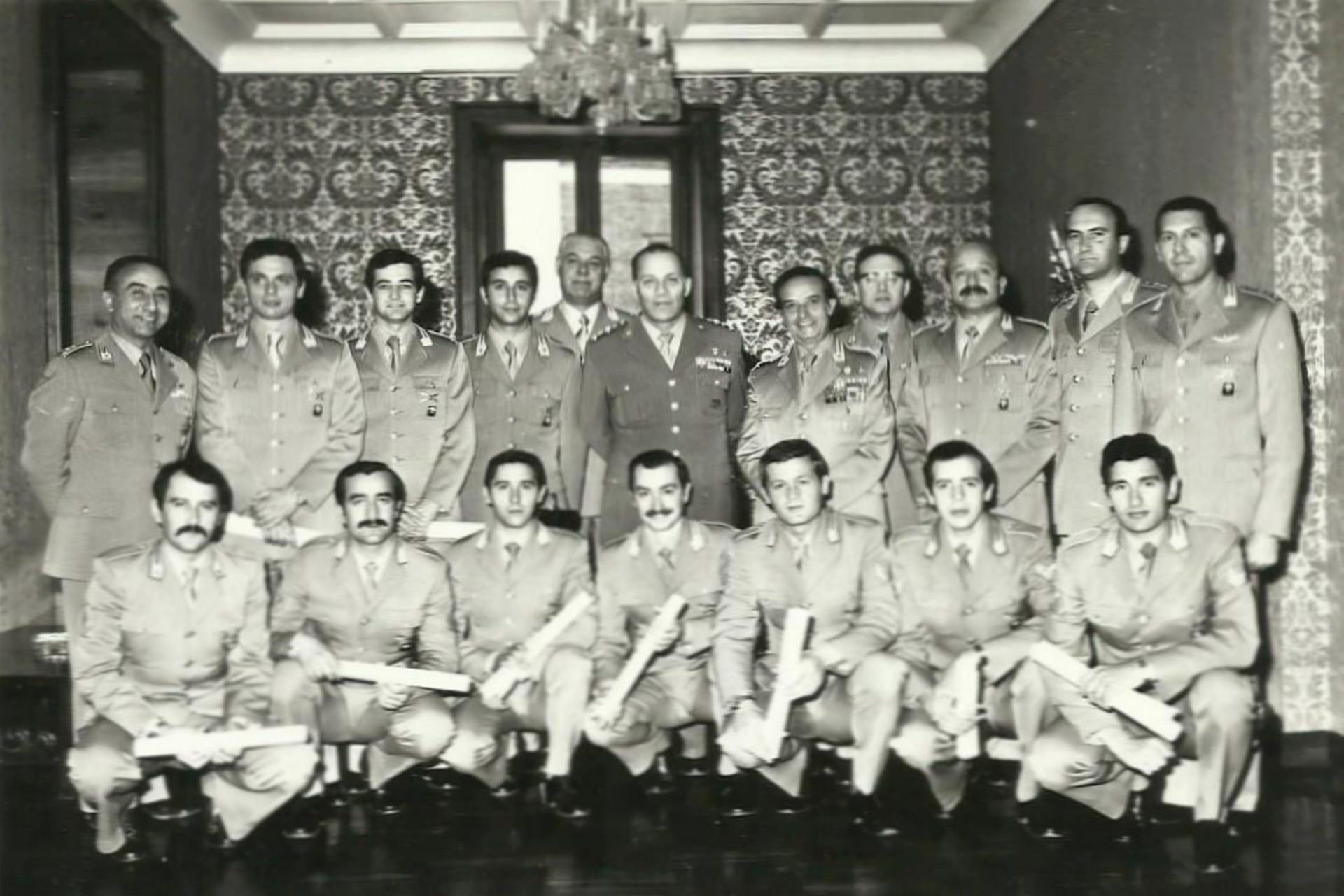
1976 - Comando Generale del Corpo – Cerimonia di consegna del brevetto di pilota militare di elicottero ai neo-piloti.