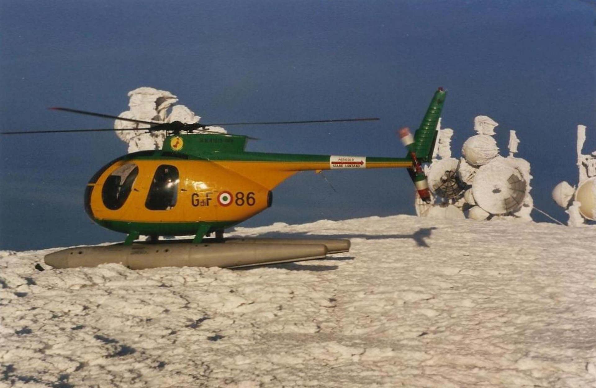
1992 – Aprile – Monte Maggiorasca (Appennino Ligure) – Q. 1990 mt Sullo sfondo: impianto per la ripetizione di segnale televisivi.