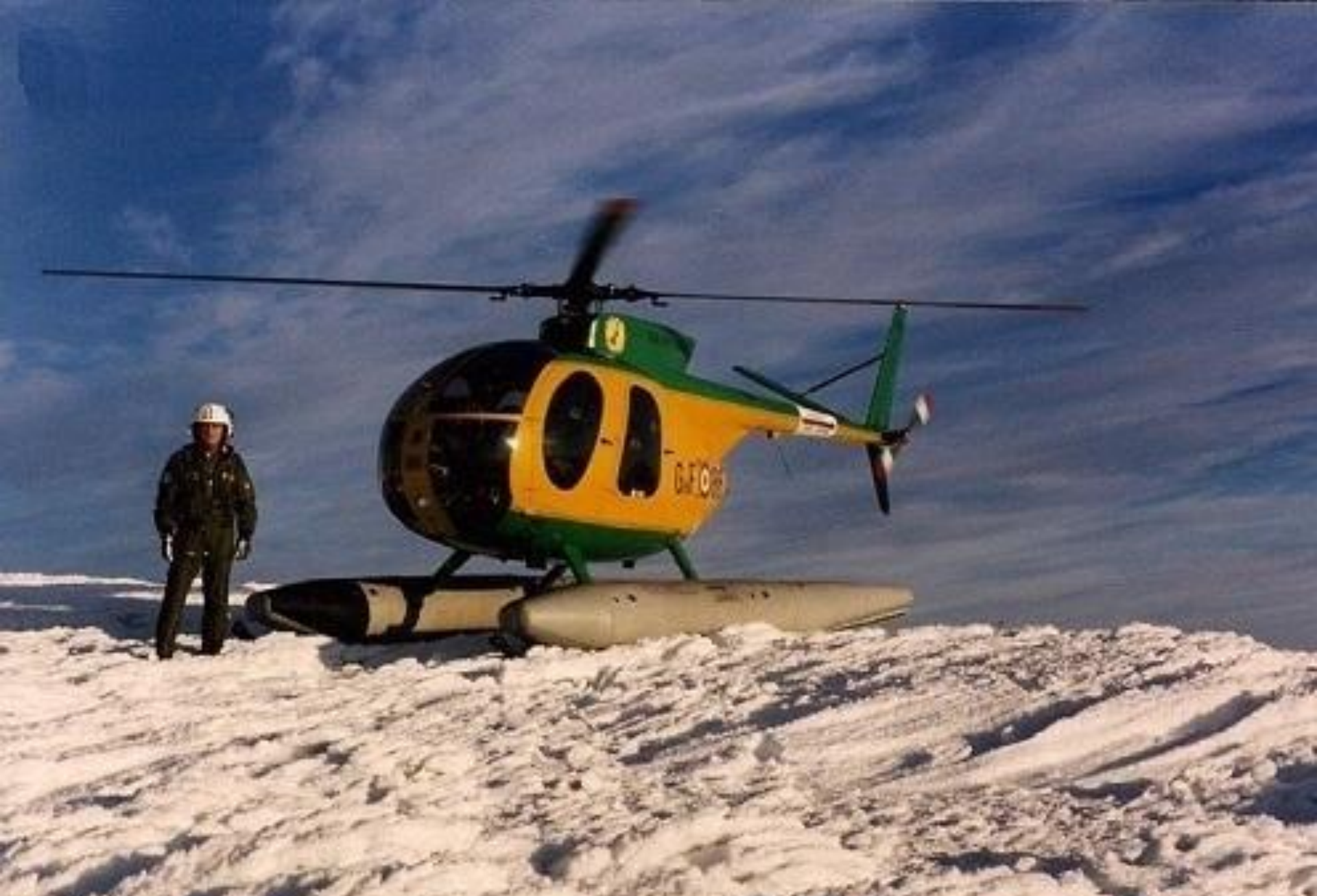
1992 – Aprile – Monte Maggiorasca (Appennino Ligure) – Q. 1990 mt Sullo sfondo: impianto per la ripetizione di segnale televisivi.