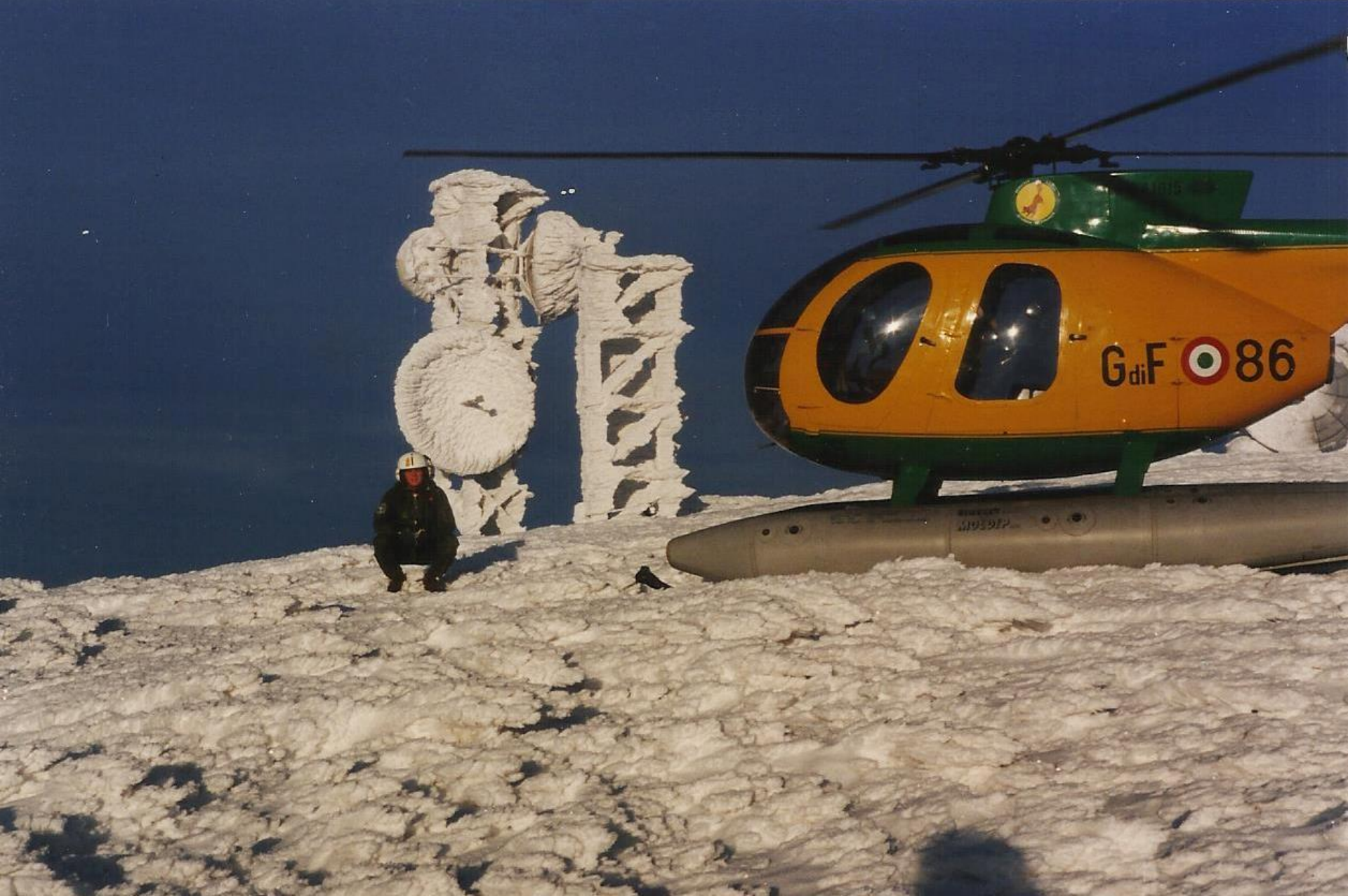
1992 – Aprile – Monte Maggiorasca (Appennino Ligure) – Q. 1990 mt Sullo sfondo: impianto per la ripetizione di segnale televisivi.