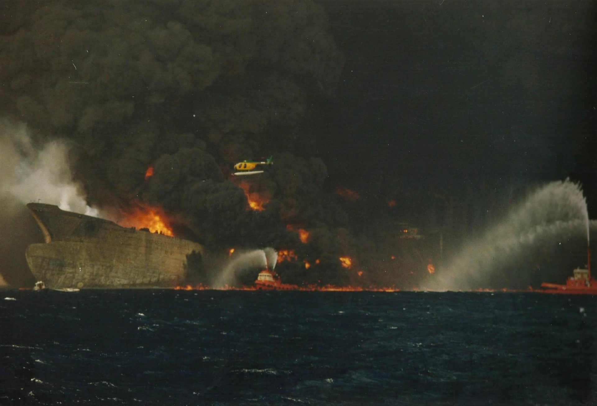
1991 11 aprile – Golfo di Genova – La petroliera HAVEN in fiamme.