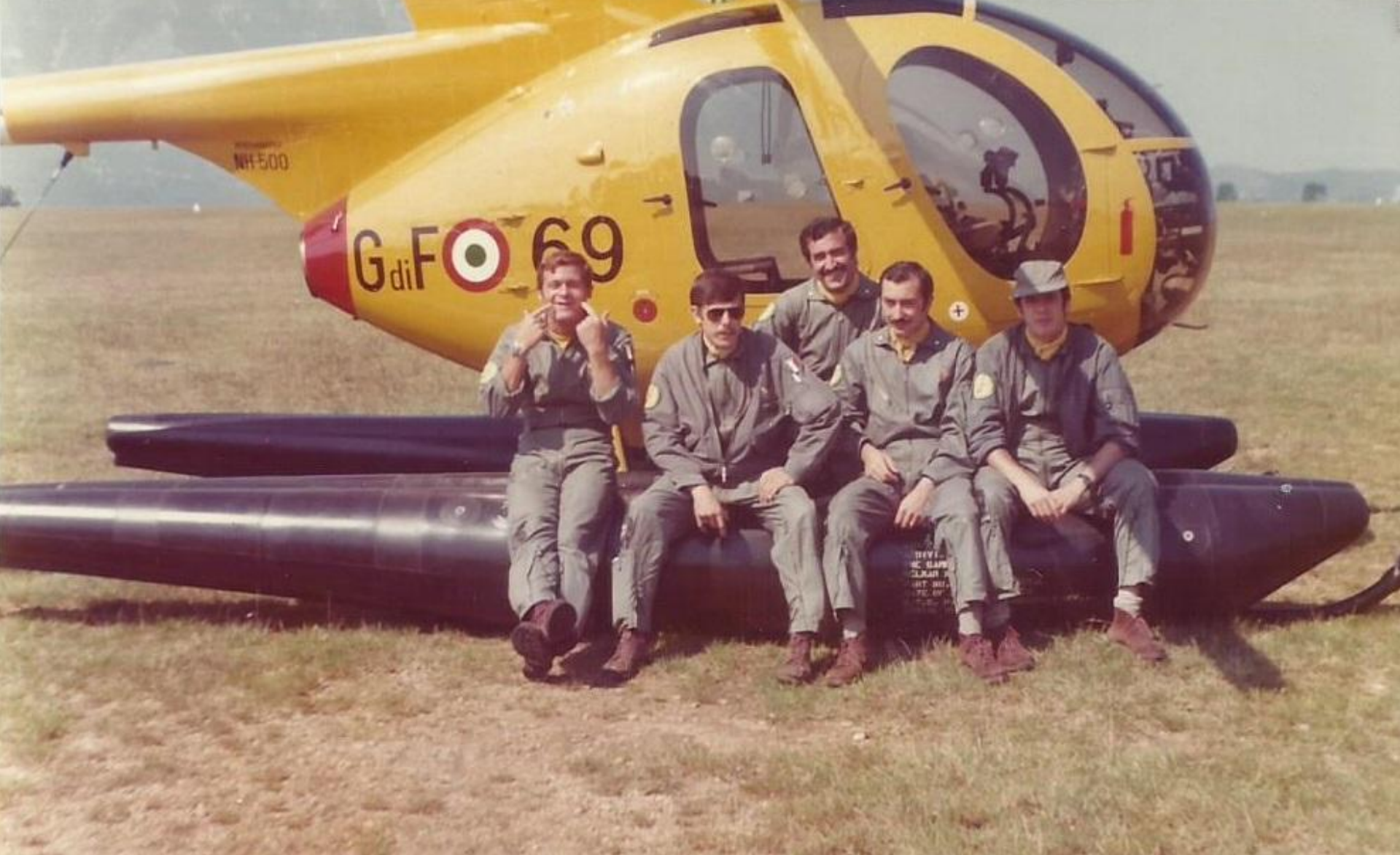
1976 - Frosinone – Scuola A.M. per piloti - 143° Corso piloti della GdF