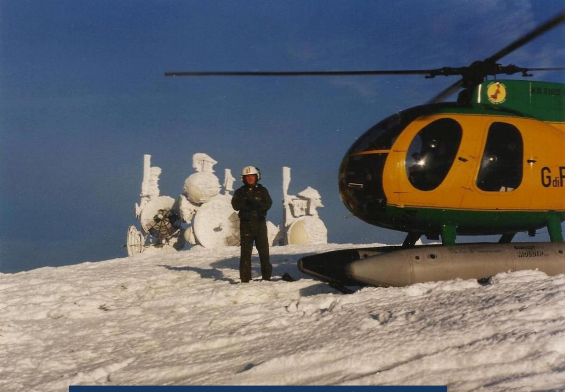
1992 – Aprile – Monte Maggiorasca (Appennino Ligure) – Q. 1990 mt Sullo sfondo: impianto per la ripetizione di segnale televisivi.