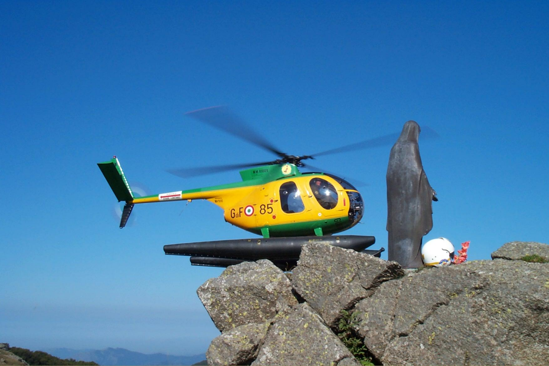
Monte Penna (Appennino Ligure)