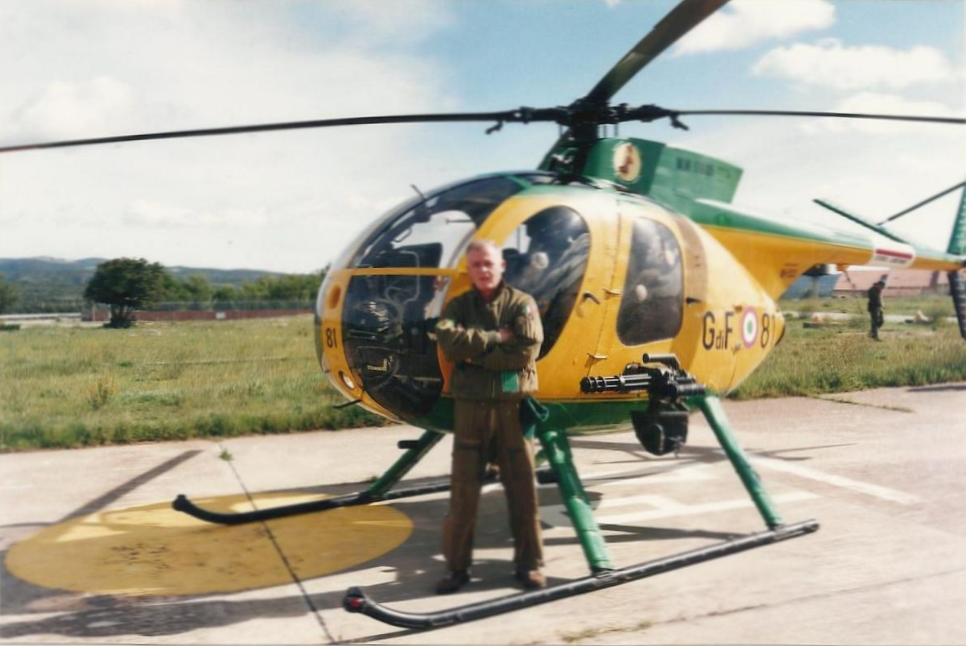
Poligono di tiro di Perdasdefogu