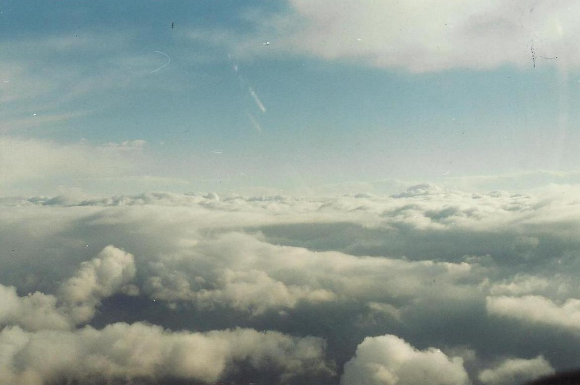
Nubi sul poligono di tiro di Perdasdefogu