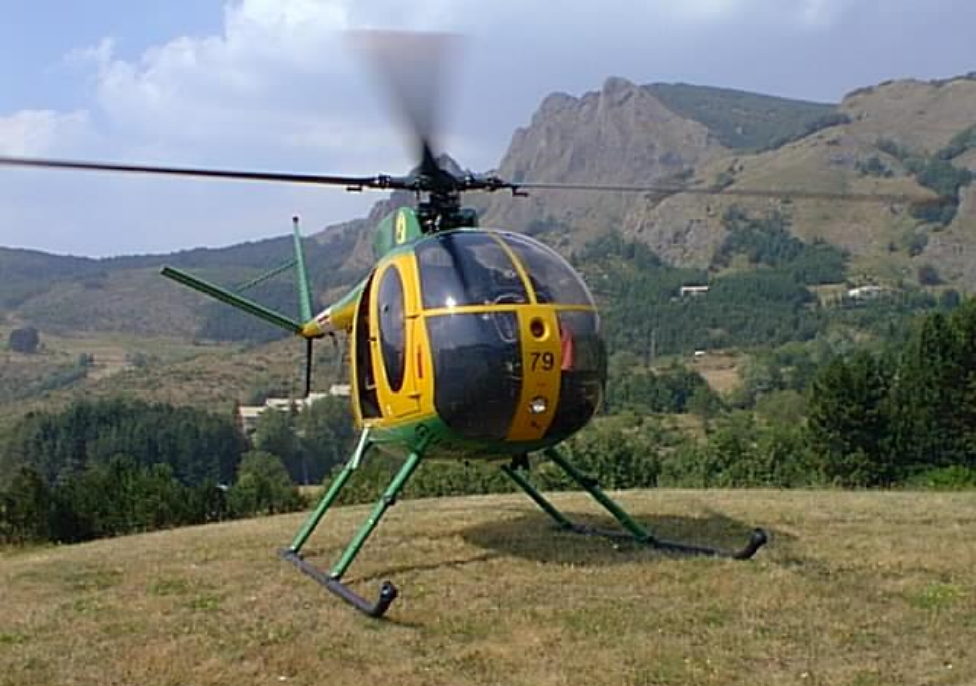
1998 – Luglio – Santo Stefano d'Aveto (Liguria) – Q. 1500 mt.