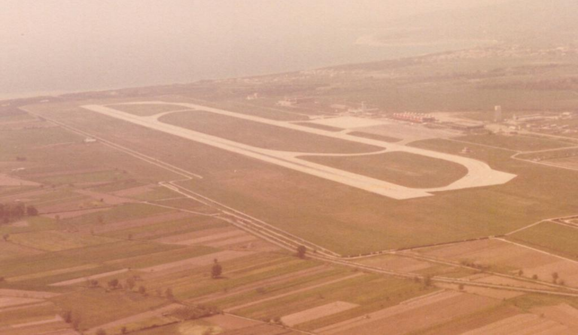
1982 Aprile - Aeroporto di Lametia Terme – Vista panoramica.