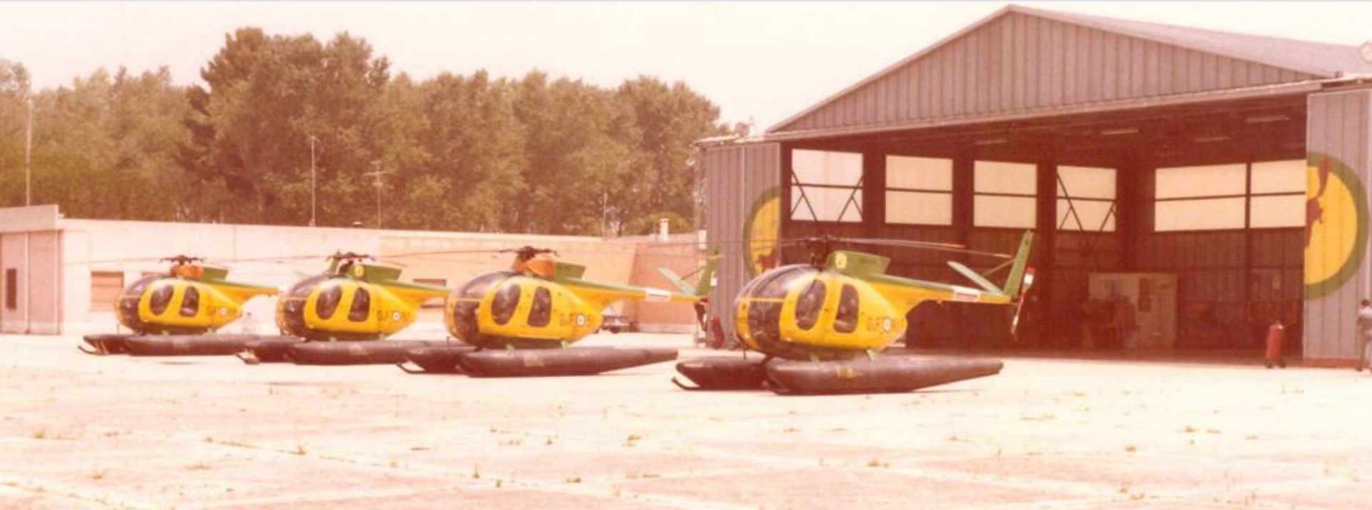
1980 Luglio - Sezione Aerea di Vibo Valentia - Piazzale elicotteri