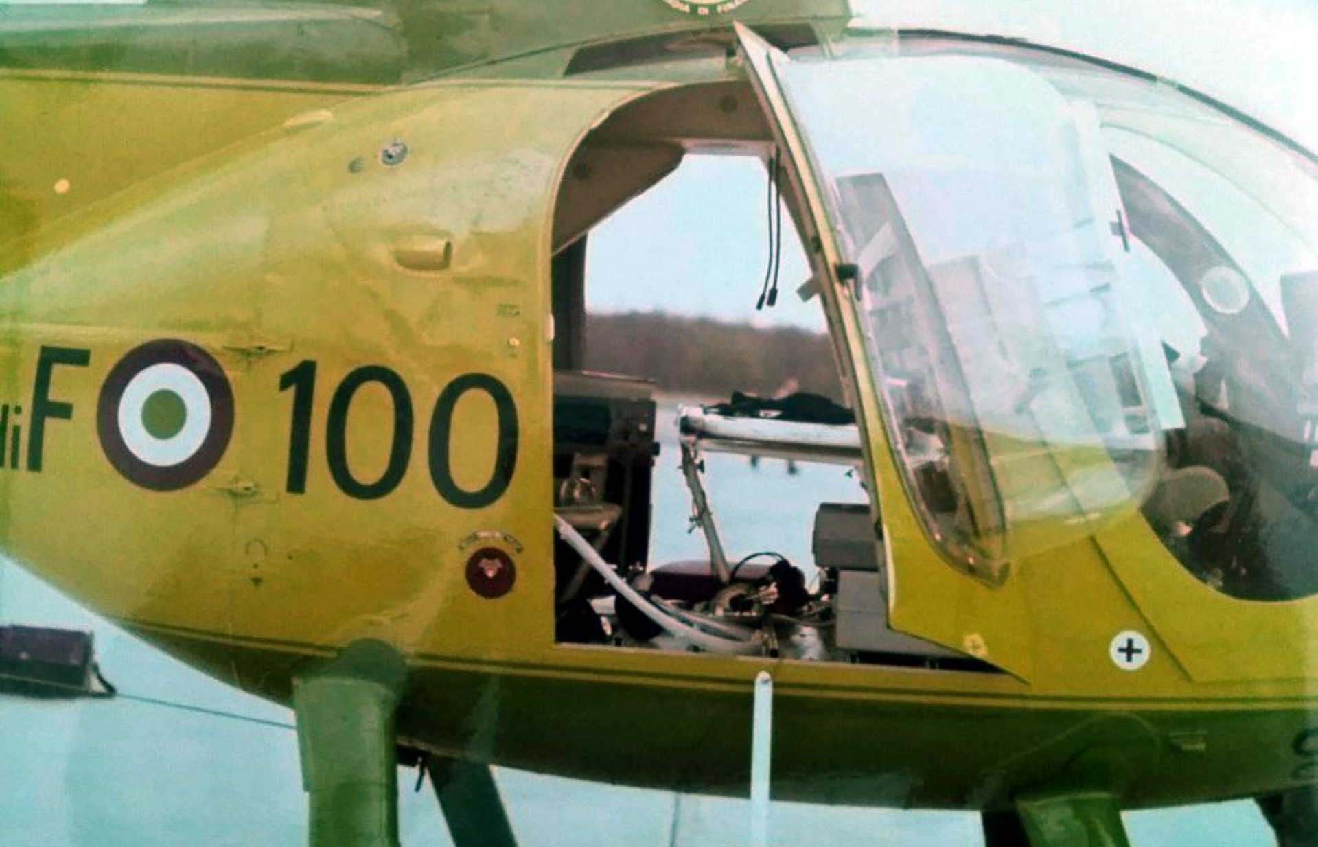
1975 - Sezione Aerea di Varese in Calcinate del Pesca (VA) - Il primo impianto di rianimazione, installato sull'elicottero NH 500MC Volpe 100, mostrato al personale medico dell'ospedale del Circolo di Varese.