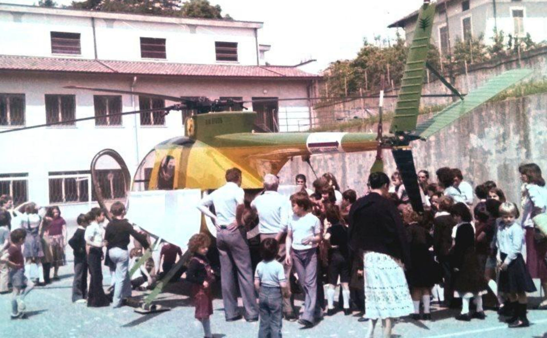
1978 - Sezione Aerea di Varese in Calcinate del Pesce ( VA) - Barasso (VA). Come da diapositiva precedente.