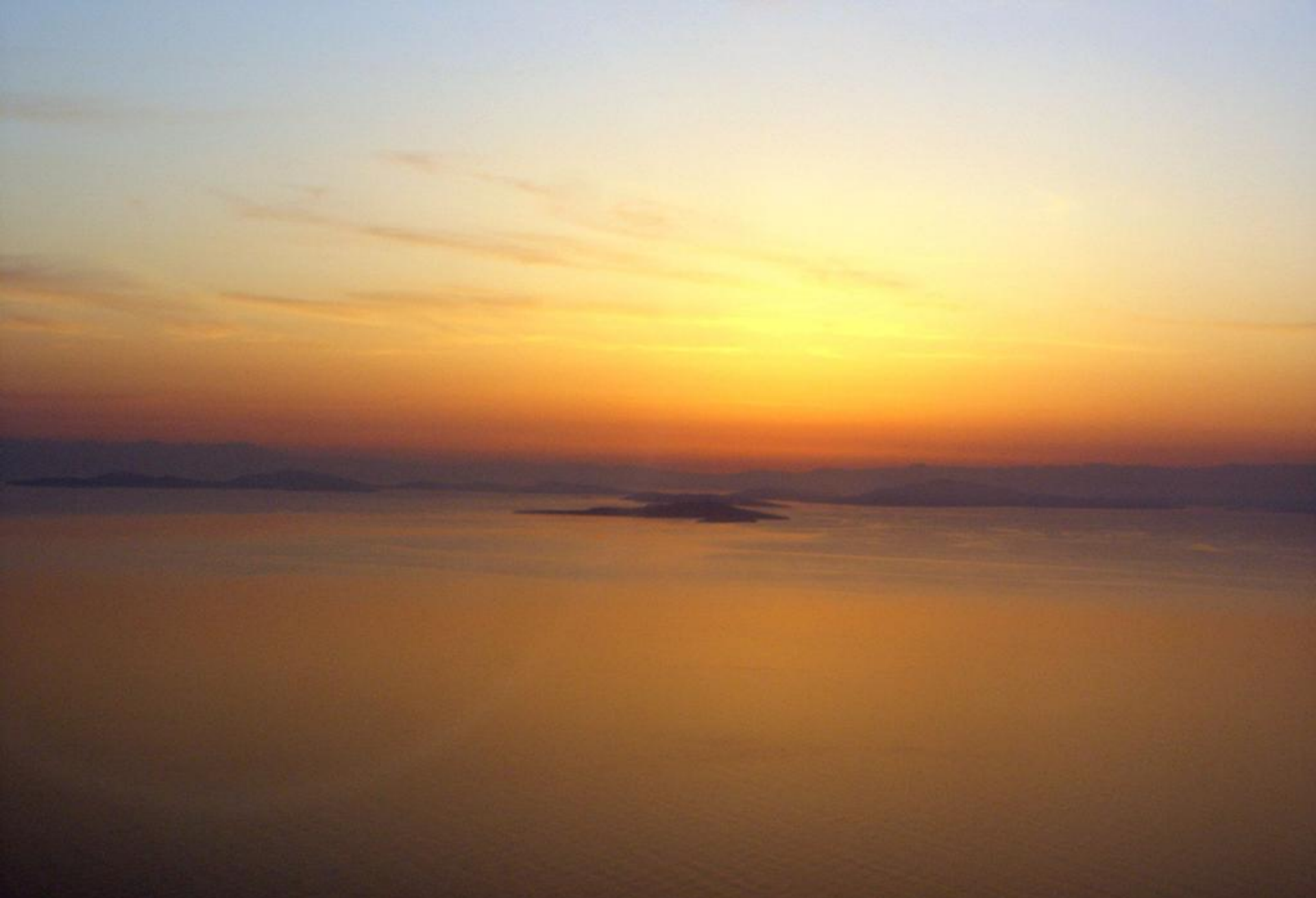
Da bordo dell'AB412 Volpe 211 – In vista dell'isola di Lesvos (Grecia) mentre l'alba appare sullo sfondo, dietro la costa turca.