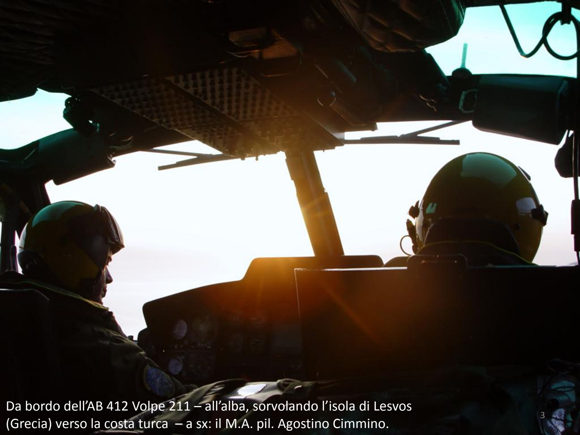
Da bordo dell'AB 412 Volpe 211 – all'alba, sorvolando l'isola di Lesvos (Grecia) verso la costa turca – a sx: il M.A. pil. Agostino Cimmino.