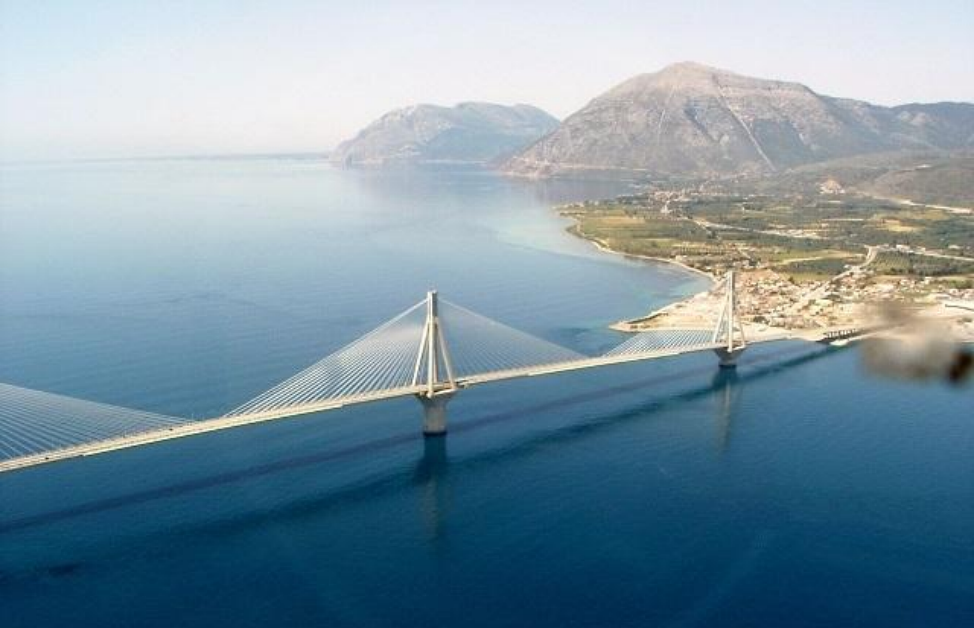
Grecia – Golfo di Corinto - Ponte “Charilaos Trikoupis” o “di Poseidone” – unisce Patrasso con Antirio.