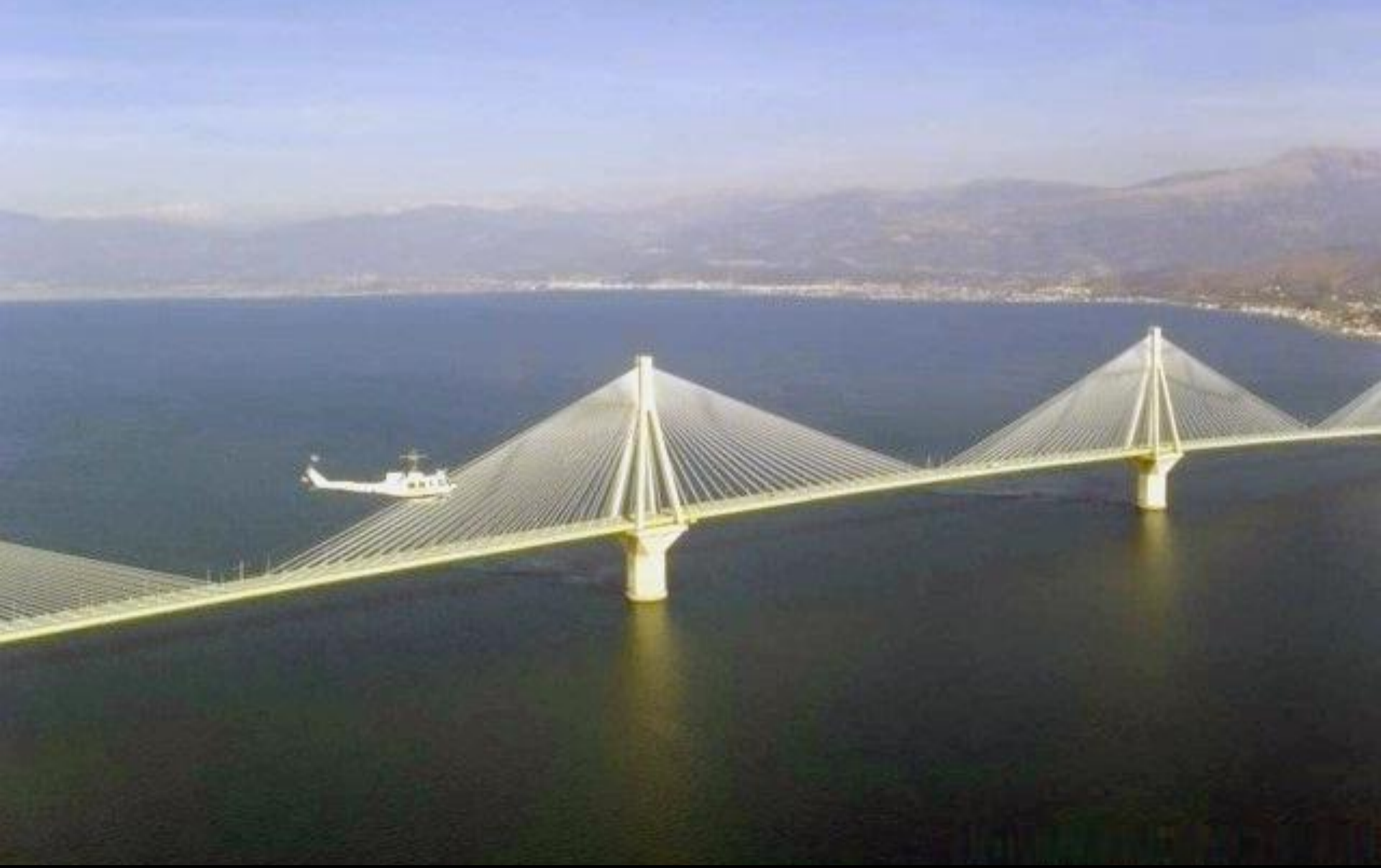
Grecia – Golfo di Corinto - Ponte “Charilaos Trikoupis”o “di Poseidone” – unisce Patrasso con Antirio.