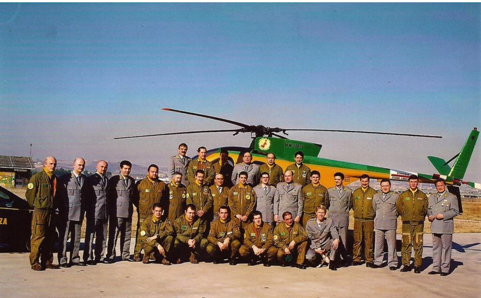
2000 - Sezione Aerea di Pescara - Foto di gruppo