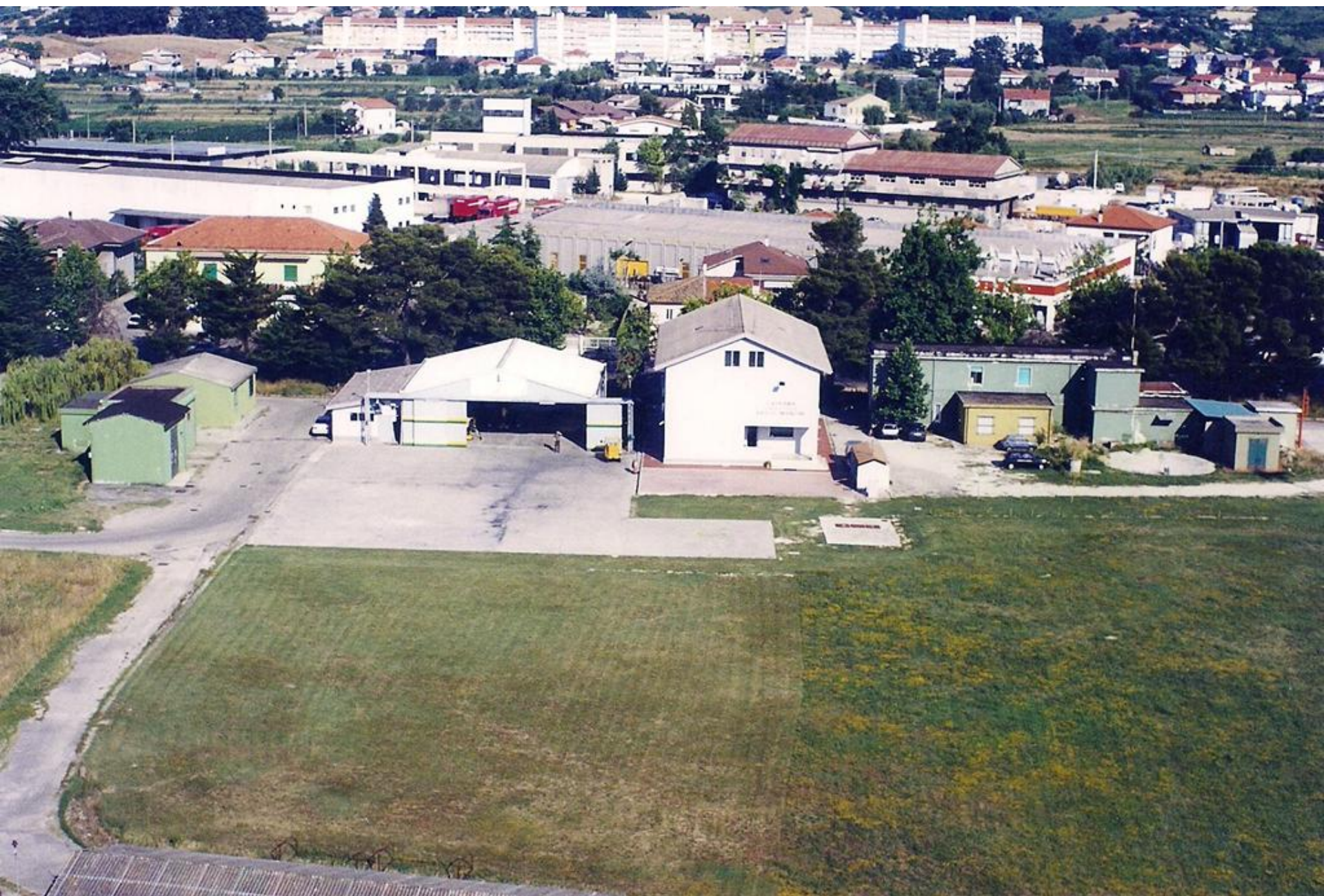
1999 - Sezione Aerea di Pescara - Hangar e caserma.