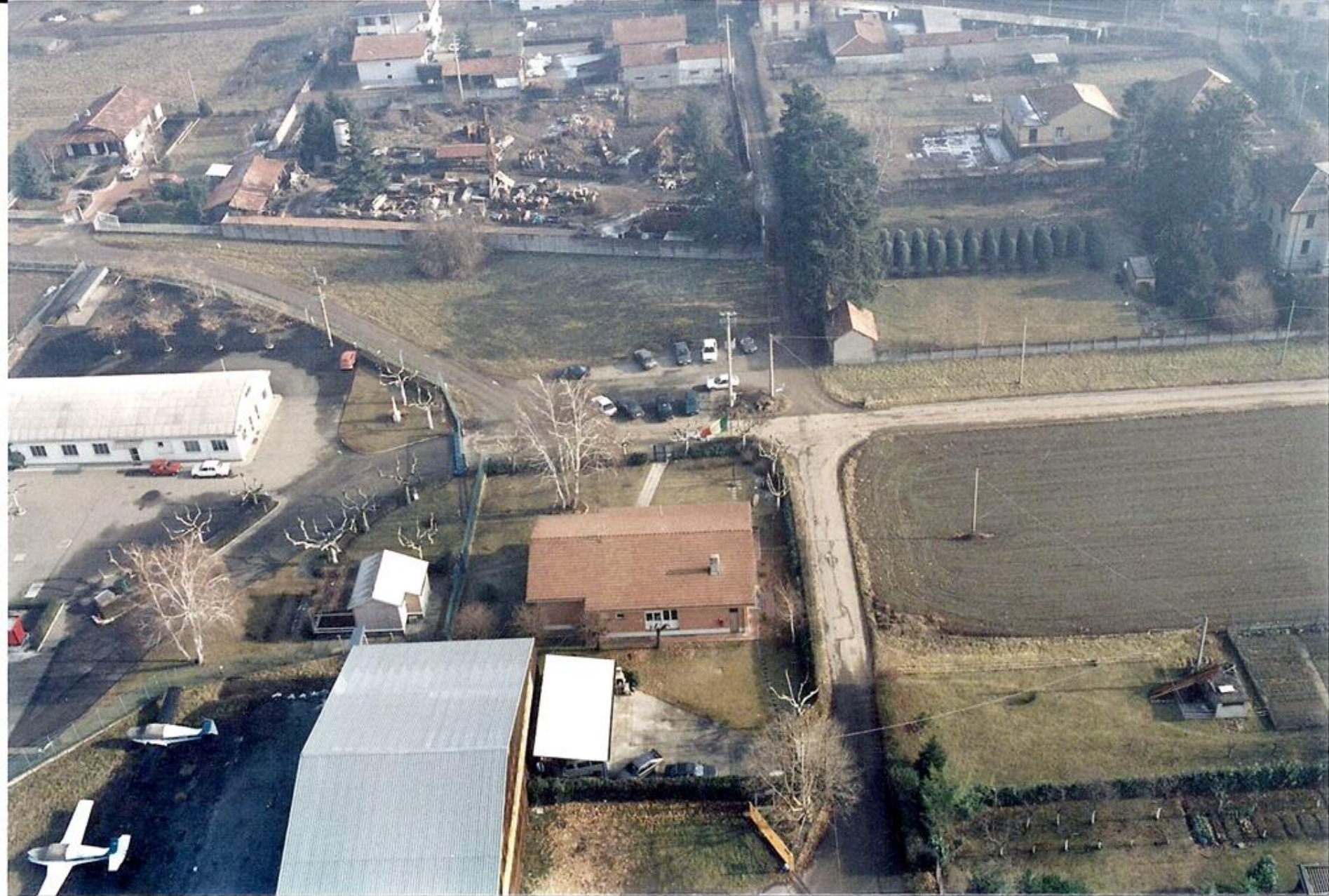
1995 - Vedute panoramiche della sedime dell' aeroporto di Venegono - Orientamento della pista 36 – 18 A sx lo stabilimento Aermacchi - a dx gli hangar ricovero velivoli e hangar Sezione Aerea.