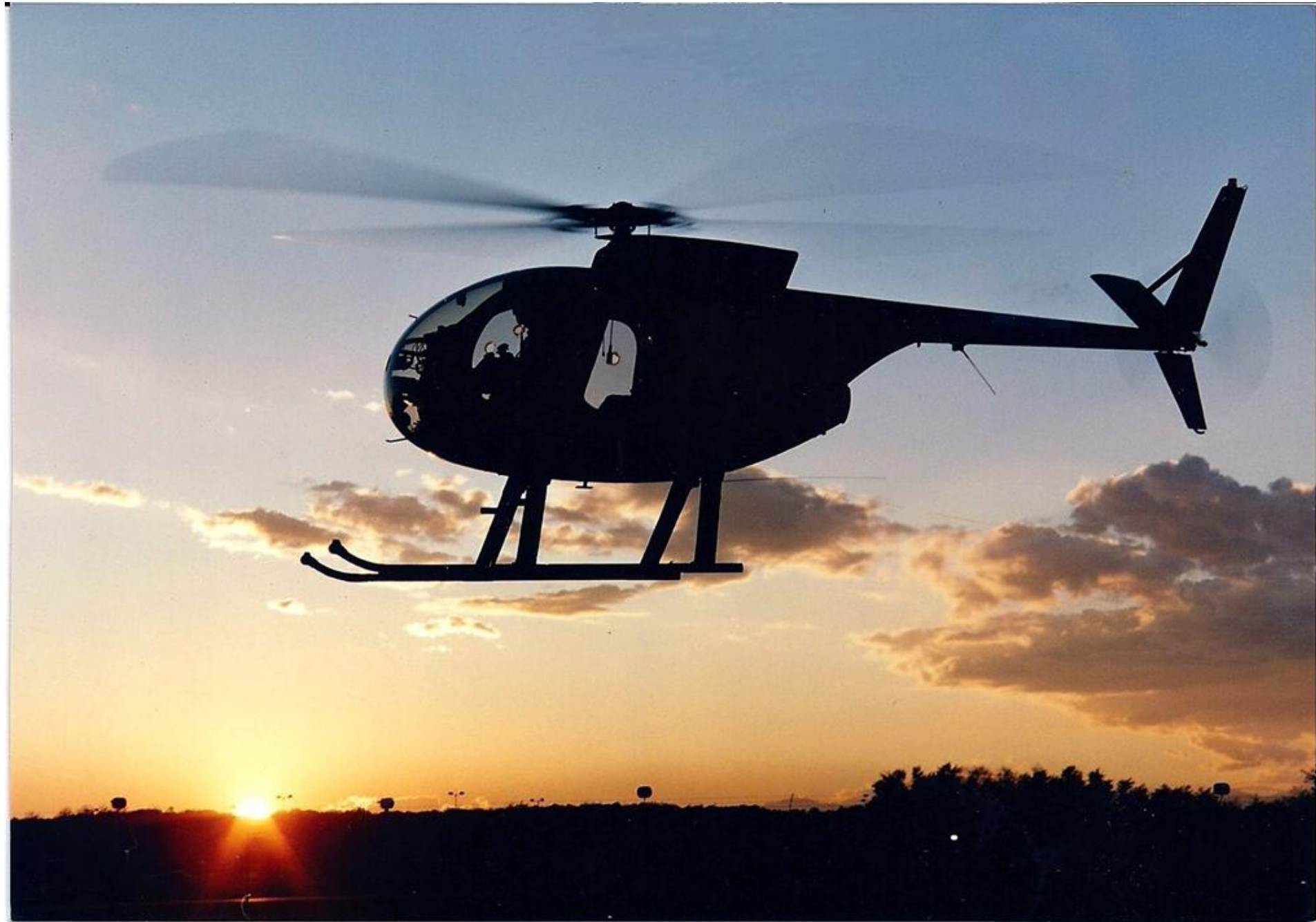
1990 - Elicottero NH 500 MC e tramonto a Venegono – Foto scattata da Cherubini Daniele.