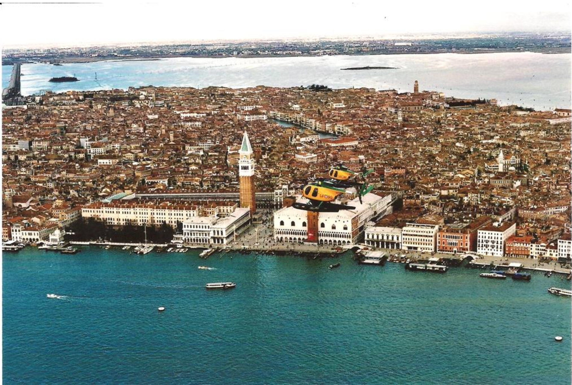
1986 - Venezia - Volpi in volo su Piazza San Marco e panorama della città.