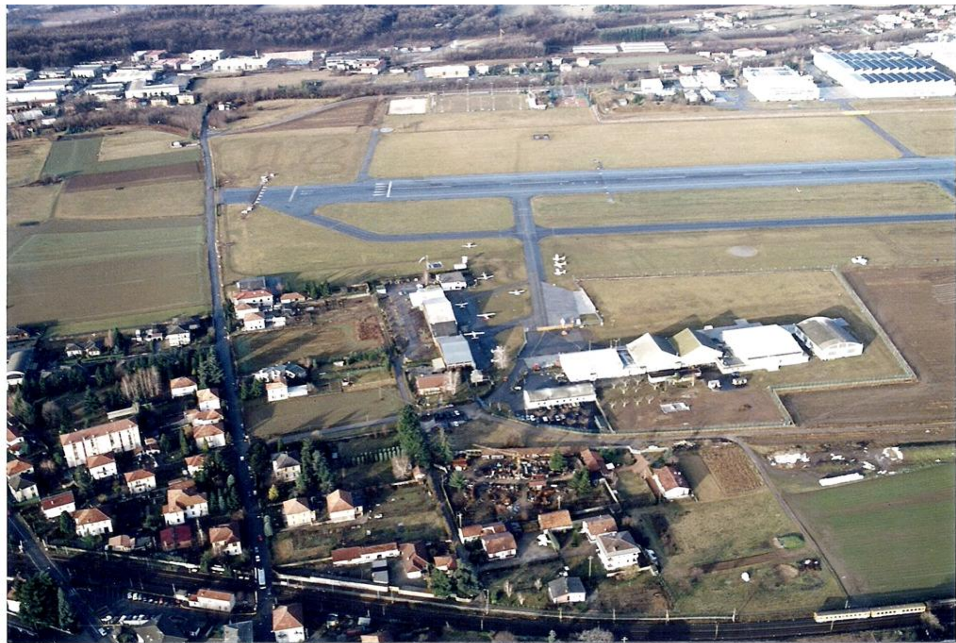
1995 - Vedute panoramiche della sedime dell'aeroporto di Venegono - Orientamento della pista 36/18 - A sx lo stabilimento Aermacchi - a dx gli hangar ricovero velivoli e hangar Sezione Aerea.