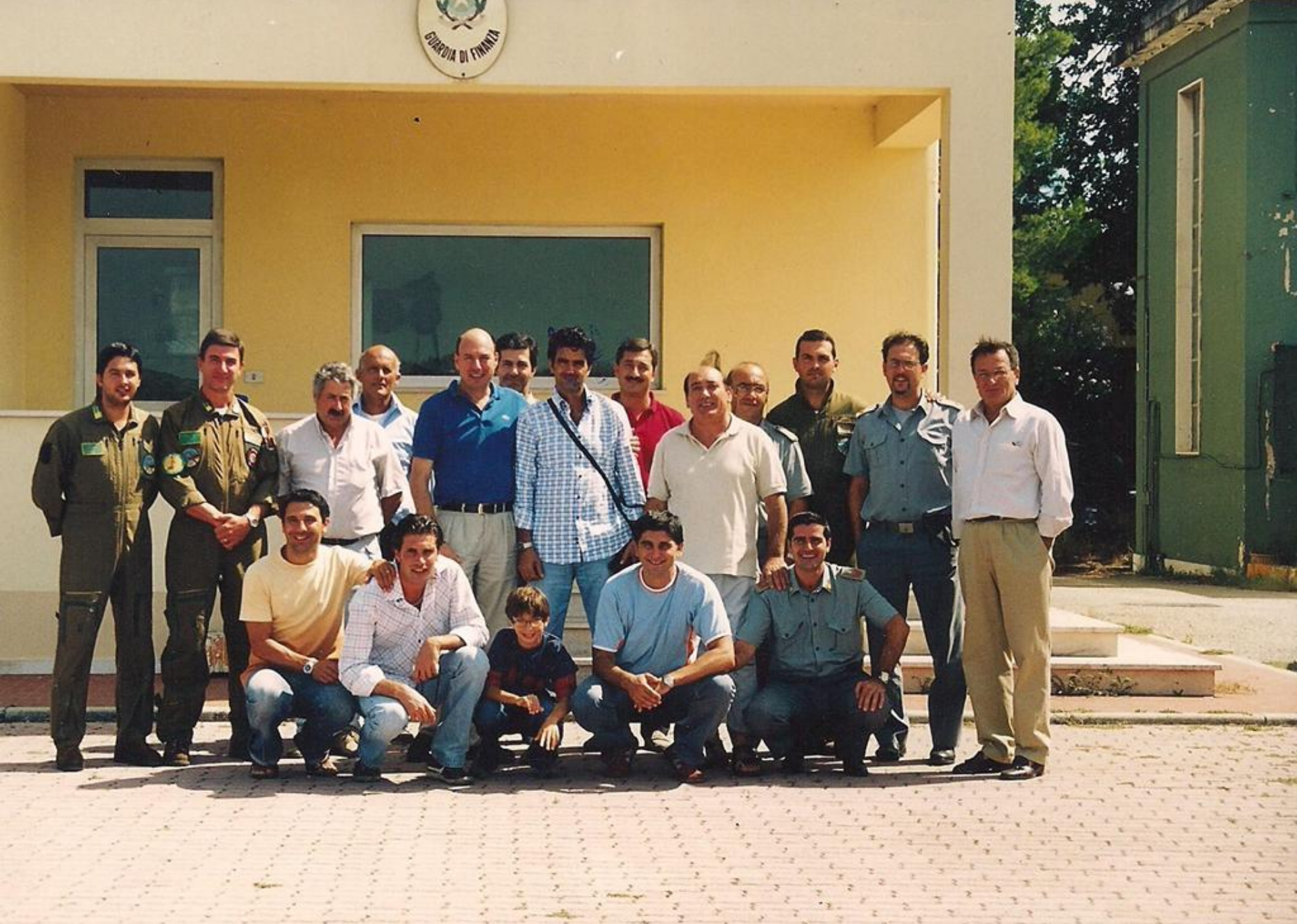
2000 - Sezione Aerea di Pescara – Componenti del reparto.