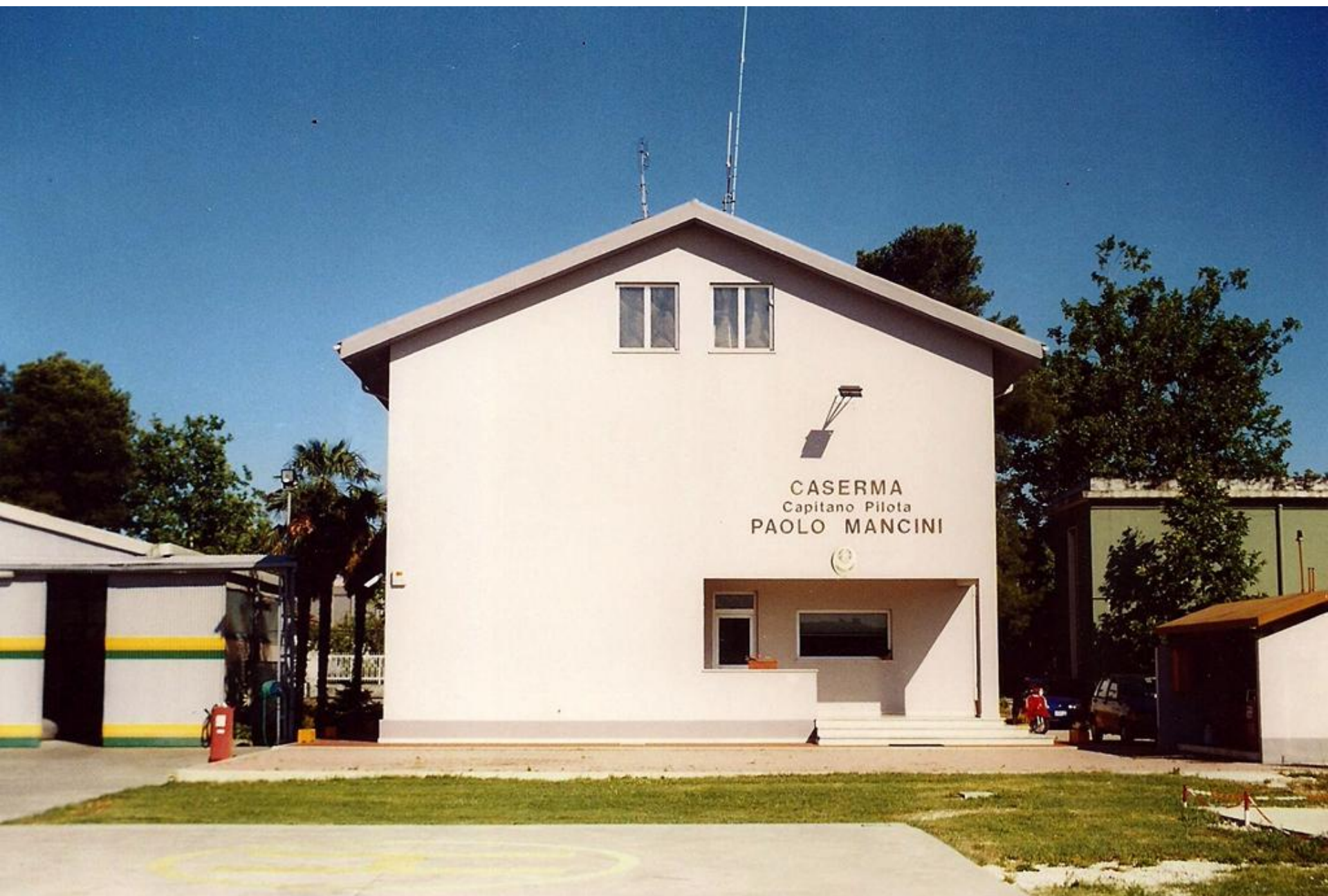
2000 - Sezione Aerea di Pescara - Caserma