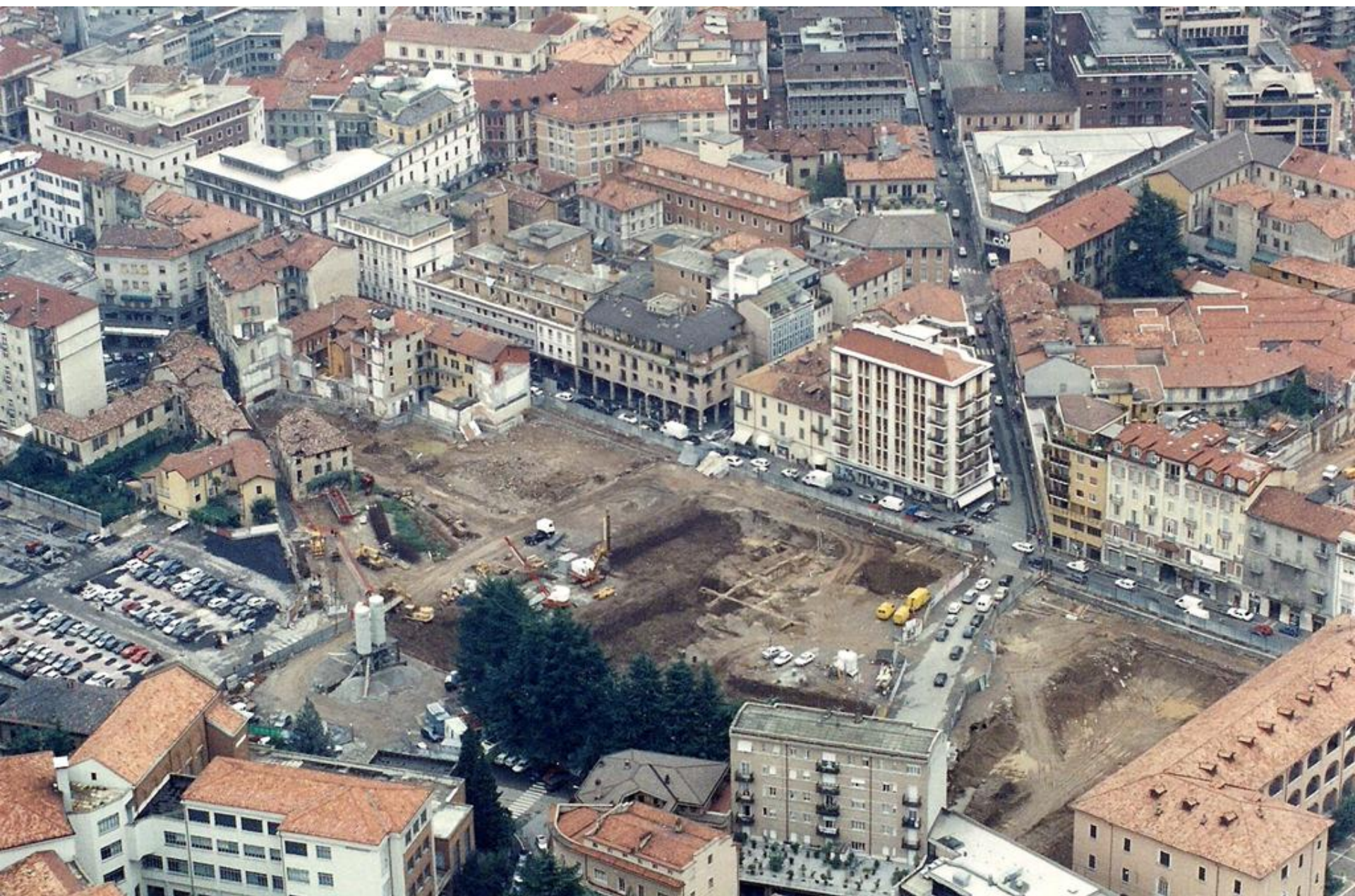
1994 - Varese - Piazza della Repubblica - Ripresa aerea dei lavori per la costruzione del centro commerciale "Le Corti" e dei parcheggi sotterranei.