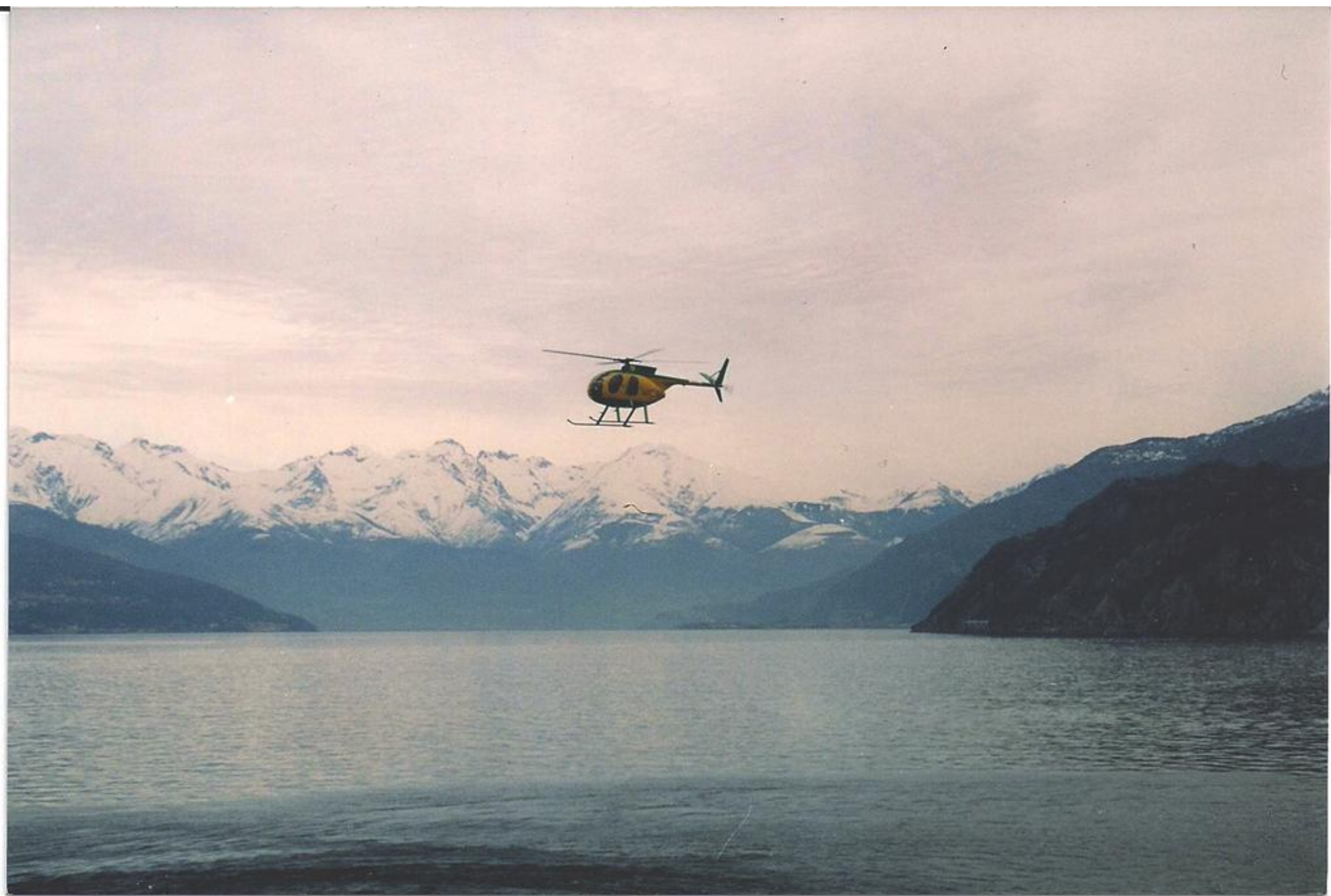
1996 - Elicottero NH500 in volo sul lago di Como.