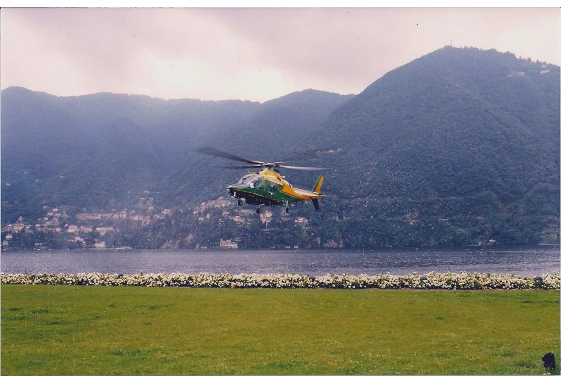
1996 - Cernobbio (CO) - Villa d'Este - A 109 in corto finale per atterraggio nel parco della villa.