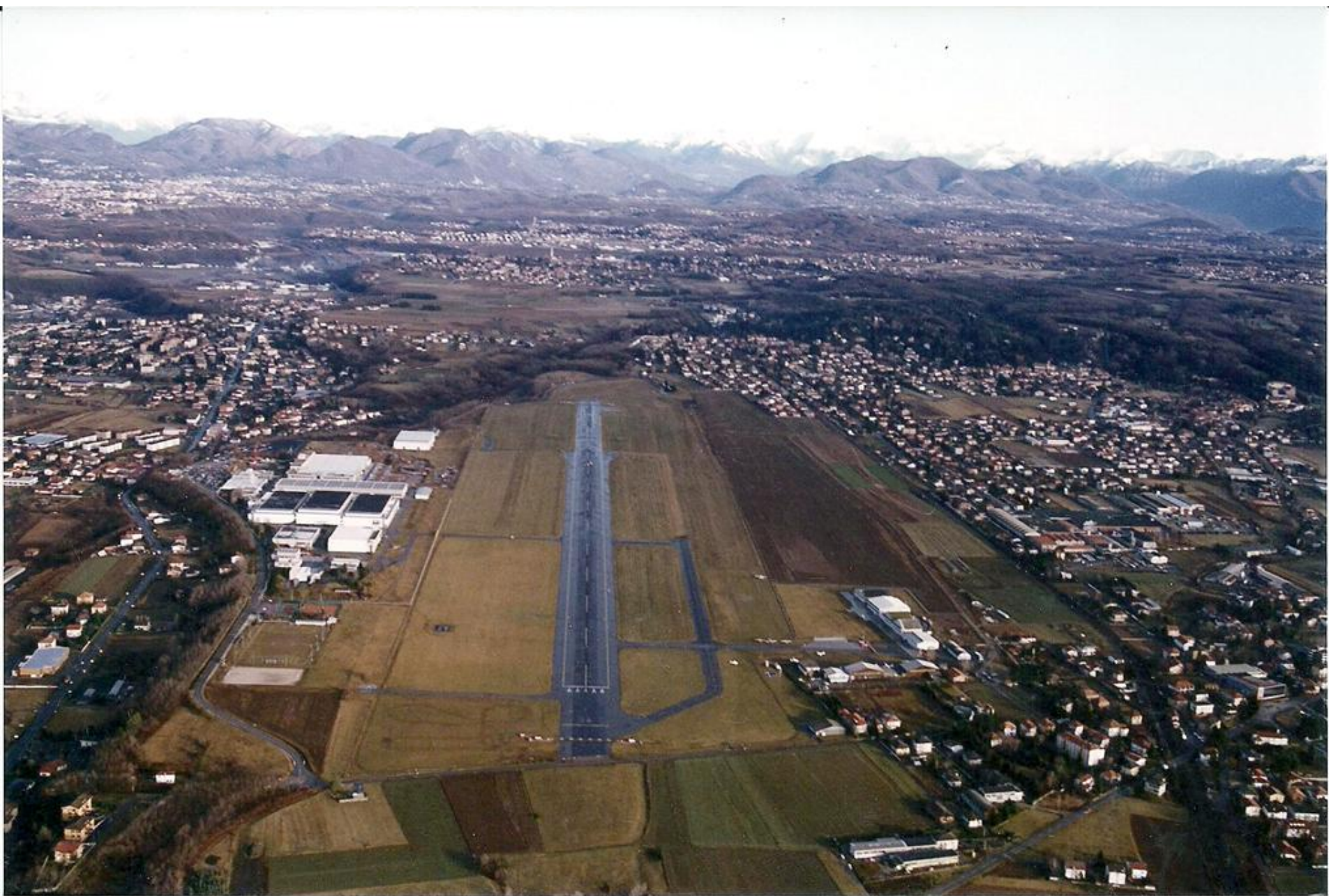
1995 -Vedute panoramiche della sedime dell' aeroporto di Venegono - Orientamento della pista 36/18 - A sx lo stabilimento Aermacchi - a dx gli hangar ricovero velivoli e hangar Sezione Aerea.