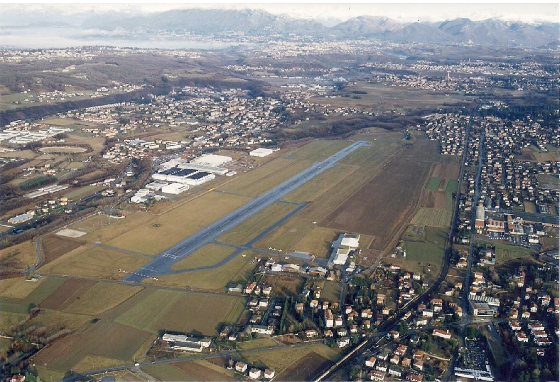
1995 - Vedute panoramiche della sedime dell' aeroporto di Venegono - Orientamento della pista 36/18 - A sx lo stabilimento Aermacchi - a dx gli hangar ricovero velivoli e hangar Sezione Aerea.