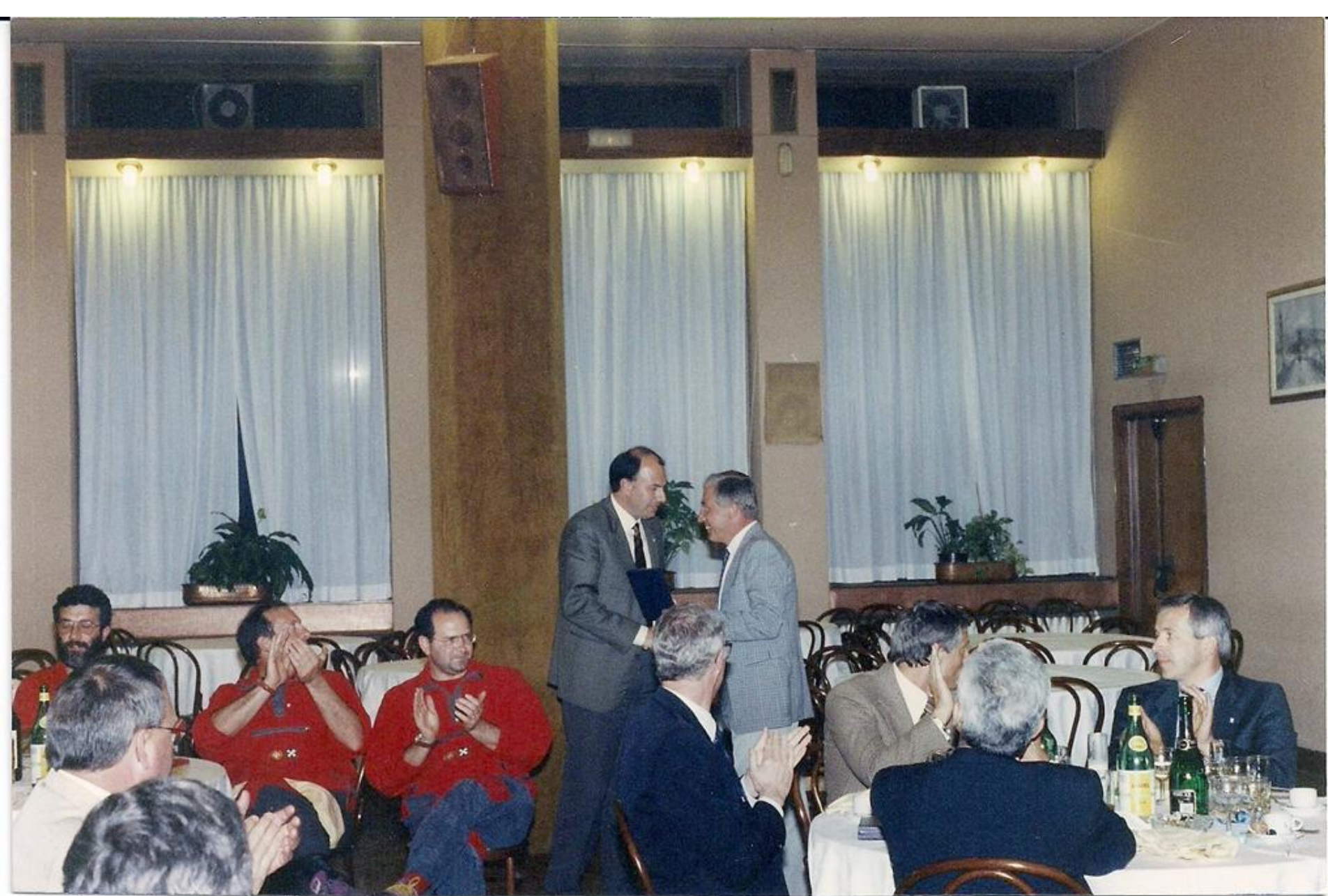
1995 - Premiazione della Sezione Aerea di Varese da parte del Comandante dell'RCC di Montevenda per i servizi di soccorso svolti.