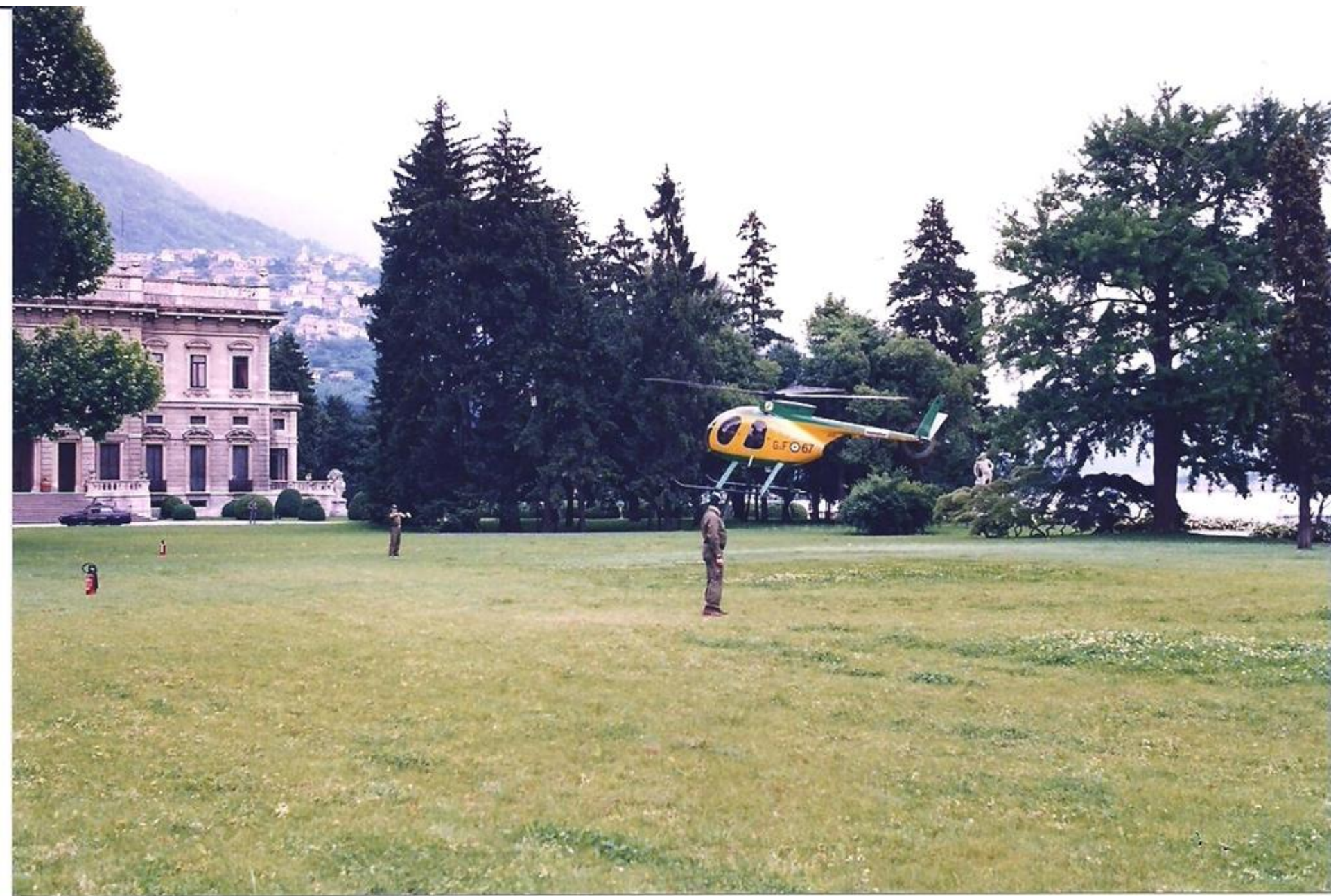
1996 - Cernobbio (CO) - Villa d'Este - Assistenza al meeting dei Capi di Stato.