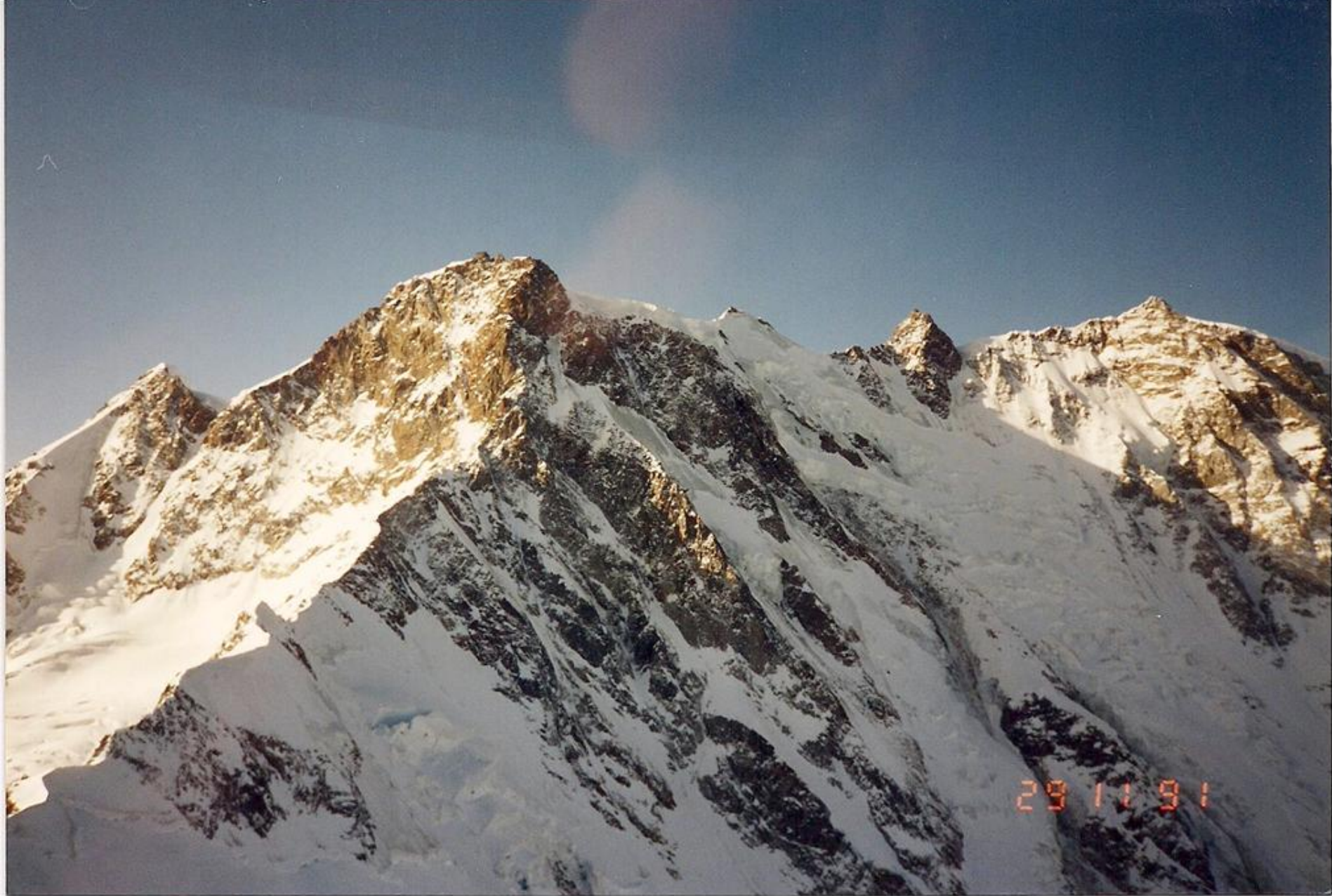
1991 29 Novembre -Ricerca per soccorso gruppo del Monte Bianco (AO)