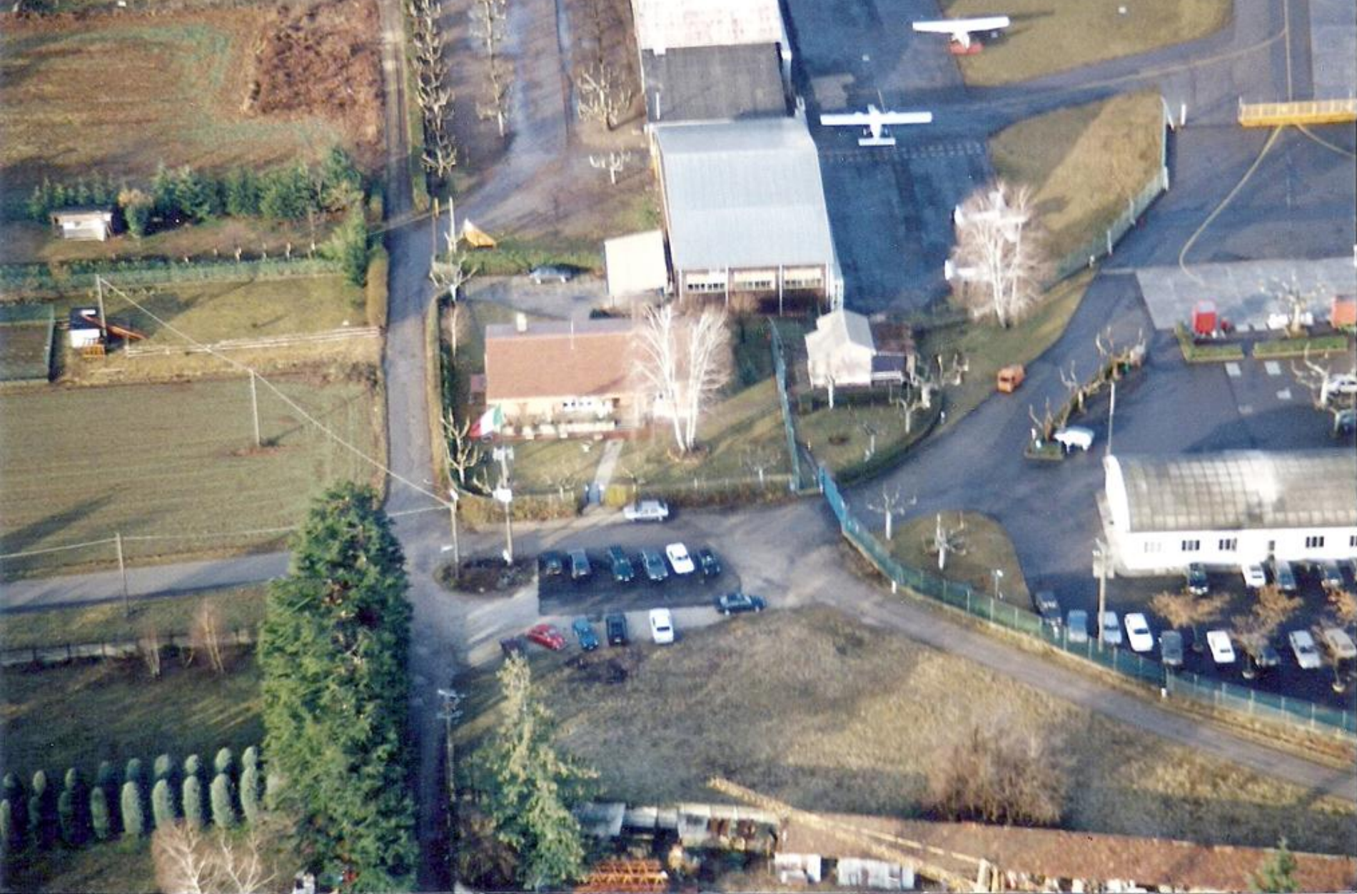
1995 - Vedute panoramiche della sedime dell'Aeroporto di Venegono - Orientamento della pista 36/18 - A sx lo stabilimento Aermacchi - a dx gli hangar ricovero velivoli e hangar Sezione Aerea.