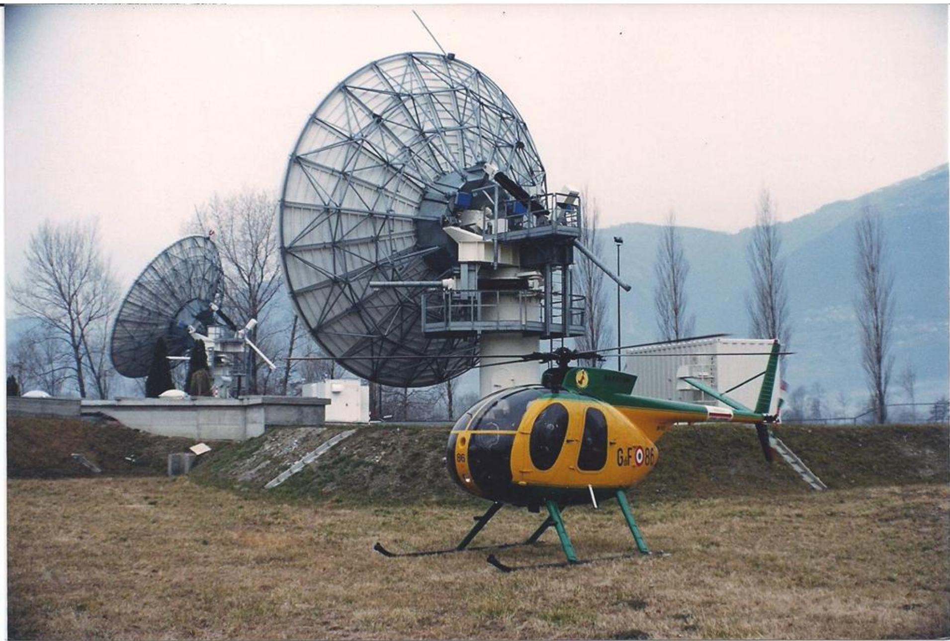
1993 - Riserva naturale di Pian di Spagna di Colico (CO). Centro comunicazioni satellitari di Telespazio.